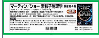
2) プログラム記事下 広告